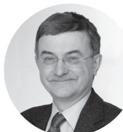
Michel HOFFMANN Président du tribunal administratif de Montreuil

Pour la première fois depuis sa création en 2009, le tribunal a dépassé en 2020 le seuil des 14 000 requêtes enregistrées (14 227, soit une hausse de 4 % par rapport à 2019).